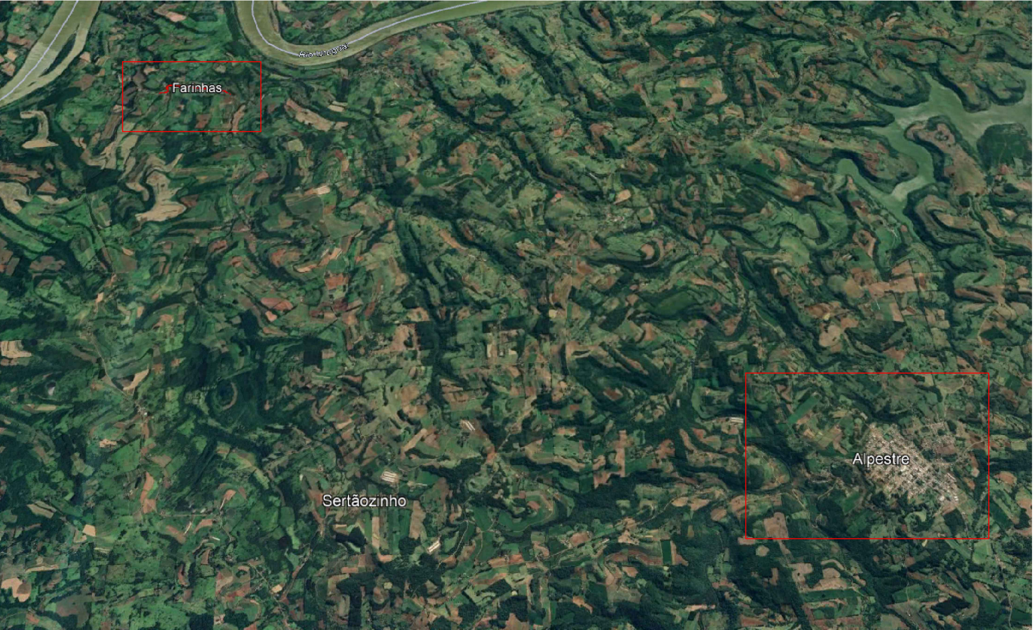
SITUAÇÃO E LOCALIZAÇÃO SEM ESCALA